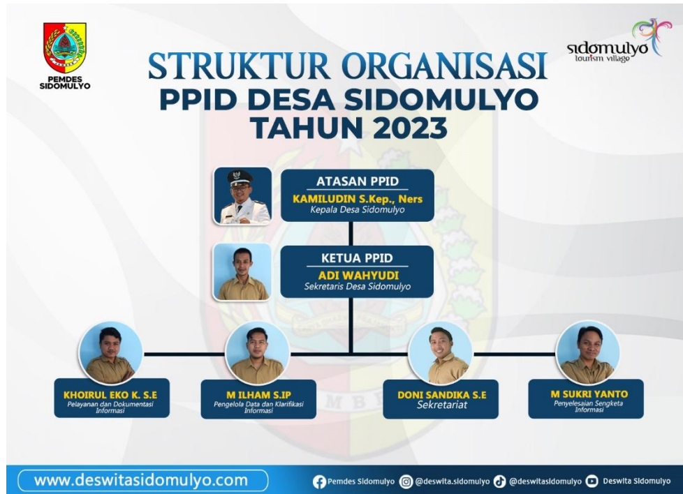
Gambar 1. 1 Struktur Organisasi PPID

Tahun 2024 Pemerintah Desa Sidomulyo Kec. Silo Kab. Jember berpartisipasi dalam monitoring dan evaluasi (monev) Keterbukaan Informasi Publik Tahun 2024 yang diselenggarakan oleh Komisi Informasi Provinsi Jawa Timur, pada penilaian tersebut PPID Pemerintah Desa Sidomulyo Kec. Silo Kab. Jember mendapat penghargaan sebagai Badan Publik yang informatif.